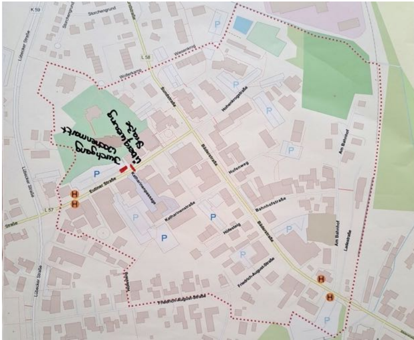
Abbildung 5: Karte Gruppe 2