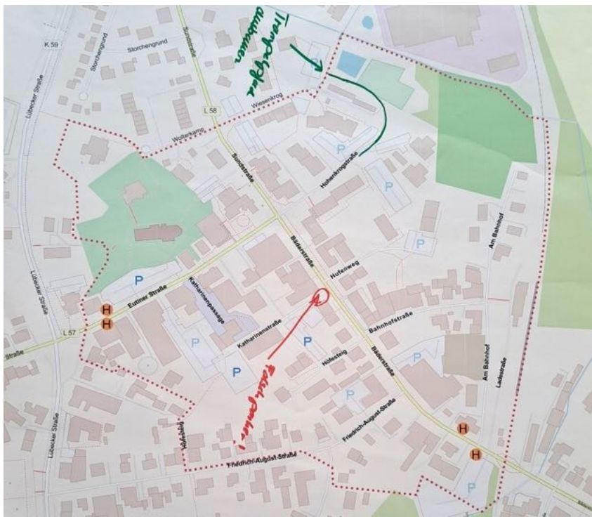
Abbildung 8: Karte mit Ergebnissen der Gruppe 5