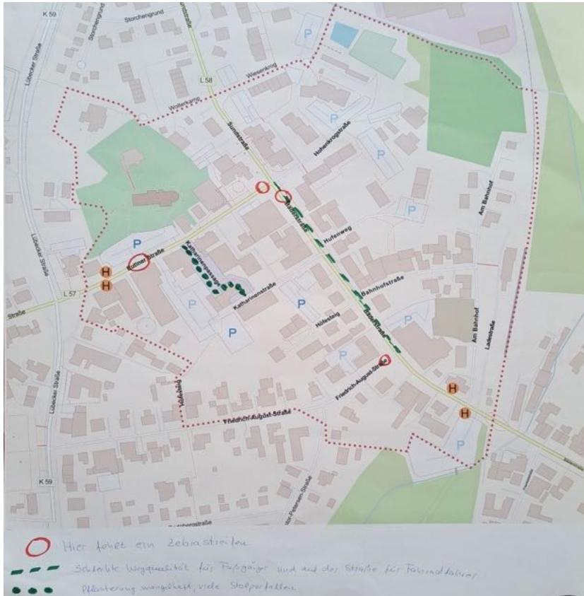
Abbildung 9: Karte Gruppe 6