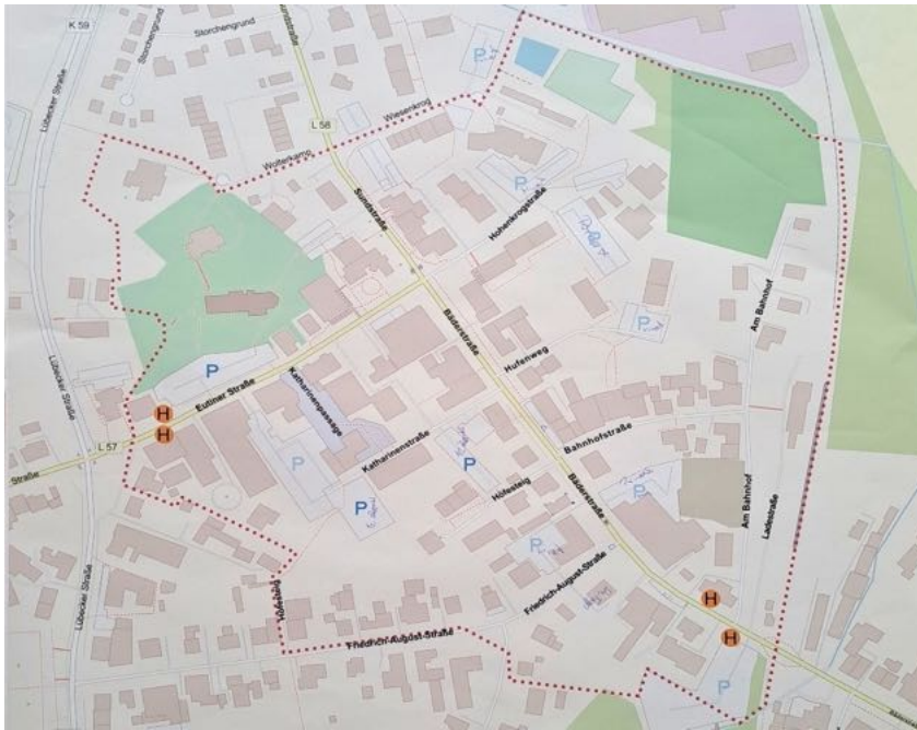
Abbildung 6: Karte mit Ergebnissen der Gruppe 3