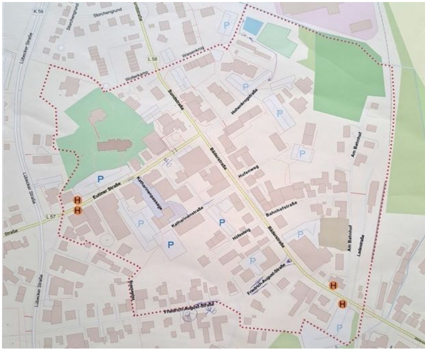
Abbildung 7: Karte Gruppe 4