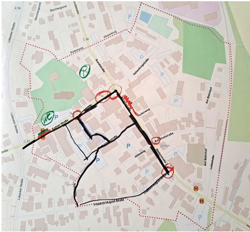
Abbildung 4: Karte Gruppe 1