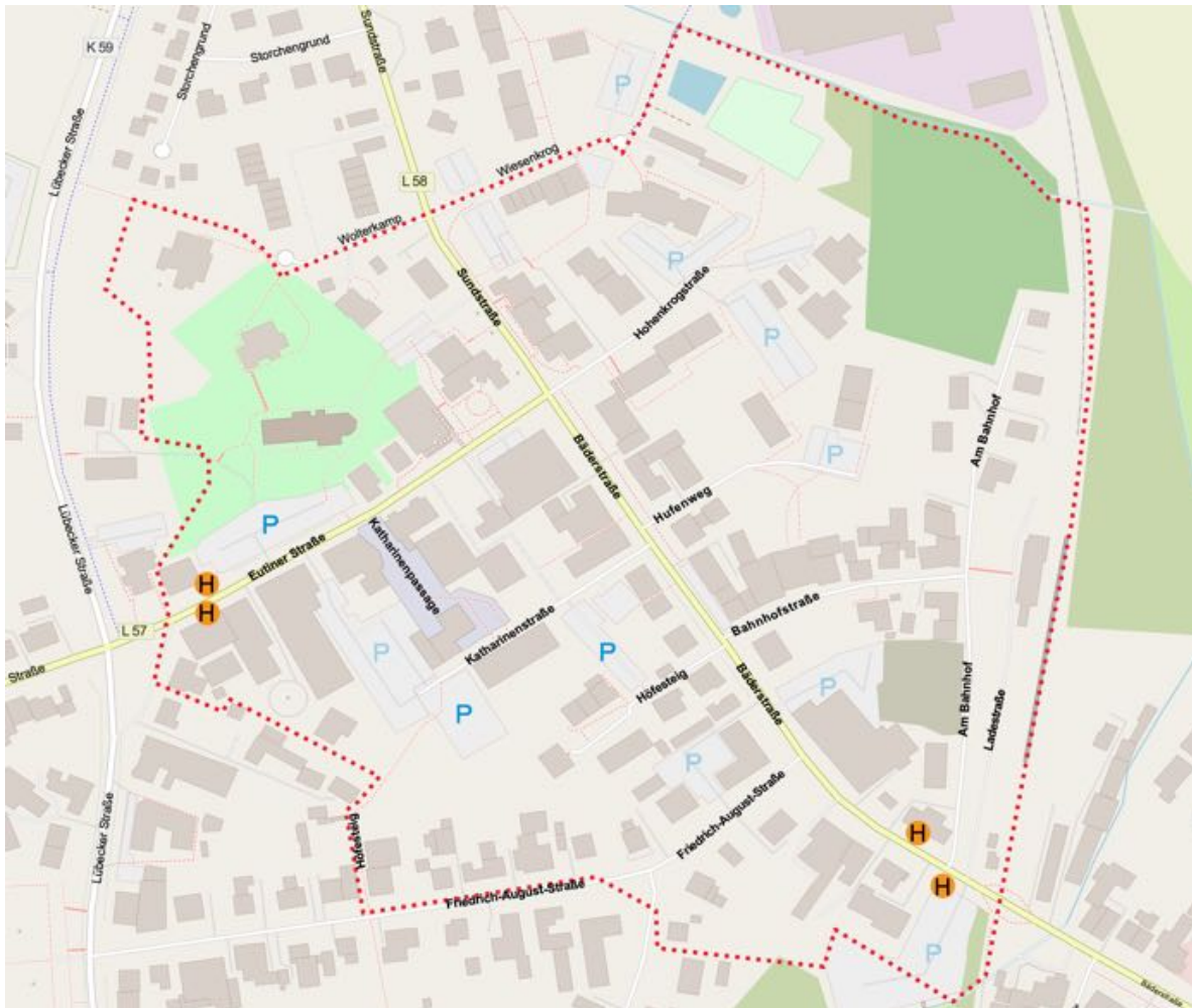
Abbildung 3: Karte des Untersuchungsgebiets Lensahn Ortsmitte

Frau Appel erläutert den Auftrag von TOLLERORT entwickeln & beteiligen, ein Konzept für den Abbau von Barrieren für das Untersuchungsgebiet „Ortsmitte“ zu erarbeiten. Zielgruppen und Interessierte werden einbezogen. Ende Juni wurden an einem Stand auf dem Markt Zufallsbegegnungen gestaltet. Hinweise von Besucher:innen wurden aufgenommen. Zudem wurden Hilfsmittel angeboten, die Erfahrungen mit Beeinträchtigungen, etwa im Rollstuhl/Rollator, mit Langstock und zum Beispiel Augenbinde simulieren. Ein weiterer Teil des Dialogverfahrens ist der Workshop.