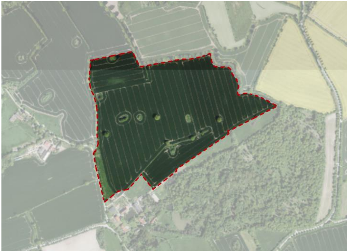
Abb.: Luftbild mit Geltungsbereich

Innerhalb des Plangebietes befinden sich mehrere Einzelbäume sowie Kleingewässer. Derzeit wird das Plangebiet ackerbaulich genutzt.